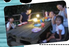
秋の 夜長は まったりと...