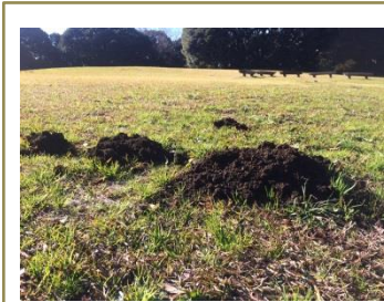
↑小さいものや大きなもの。

茶色い芝が目立つようになった芝生広場にぽこぽこと並んだ小さいお山。実はこのお山はモグラがトンネルを掘った後の残土です。“モグラ塚”と呼ばれています。