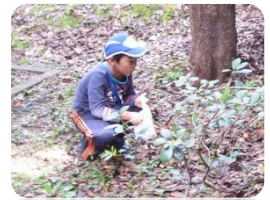
真剣な顔で生き物の調 査に取り組んでいます。