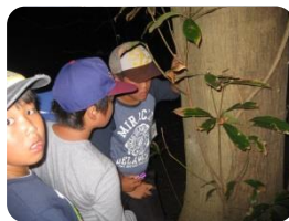
夏場はセミの羽化に出 会うことも。