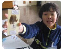
オリジナル標本作り