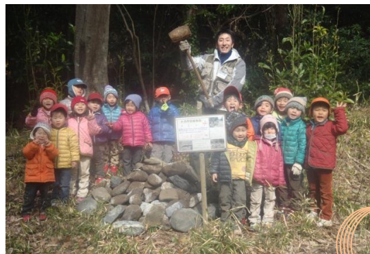
【はっぴーさん】生き物豊かな公園づくり！トカゲのすみかを作ってくれました。

園内の森や磯、広場のいたるところを園庭として活動されている通年型の森のようちえんの団体です。台風で倒れた木の枝を一緒に片づけたり、縁石を集めてトカゲのすみかを作ったりと、公園の作業と一緒に手伝ってくれる小さなレンジャーたちです。